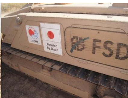
Машина по разминированию MV-4 - подарок от народа Японии