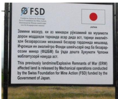
Информационная доска об успешном завершении проекта