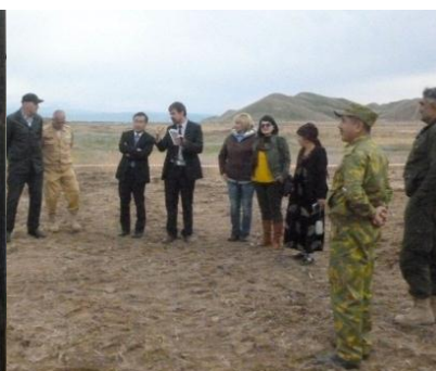
Церемония завершения проекта по разминированию на территории Фархорского района Хатлонской области