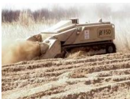
MV-4 (машина по механическому разминированию) Процесс разминирования

Согласно Оттавской Конвенции о реализации программ по разминированию, Таджикский Центр по минным вопросам планирует завершить свою деятельность по разминированию к 2020 году. Разминирование минных полей на приграничных зонах Таджикистана проводится с целью восстановления местной экономики, улучшения управления границами и безопасности в данной местности, а также внесения вклад в общую стабильность в Центральной Азии. Правительство Японии в сотрудничестве со Швейцарским фондом по разминированию (FSD), одним из опытных учреждений-исполнителей в области разминирования, путём предоставления специального оборудования для очищения минных полей поддерживает деятельность по механическому разминированию в Республике Таджикистан.