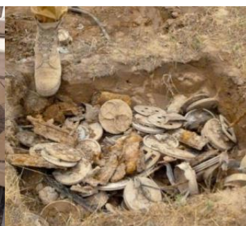
Осколки разобранных мин